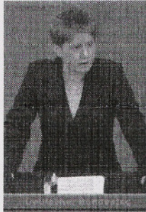
Petra Pau (Die Linke)